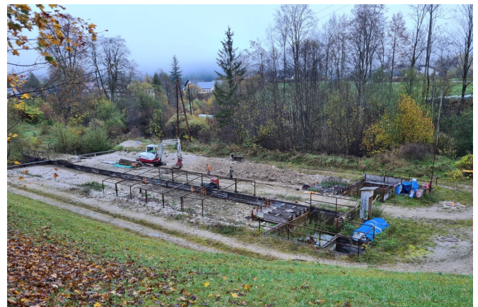
Abbildung 2: Baggerarbeiten für die Präparation des simulierten Bachlebensraums