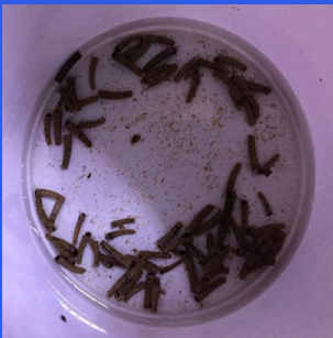
Abbildung 7: Köcherfliegen aus dem Unteren Seebach in Lunz

schung“ (Abbildung 6). Insgesamt 27 Tage lang werden regelmäßig alle vier Tage die Tiere herausgeholt, in separate Becher gesetzt und ihre Ausscheidungen gesammelt. Wir sammeln auch zusätzlich die Kombination aus feinen zerkleinerten Blattpartikeln und den Ausscheidungen der Tiere in den Mikrokosmen. Auf diese Weise können wir die Produktion des feinstpartikulären Materials genauer bestimmen. Am Ende des Experiments werden weitere Analysen zum Abbau der Blätter selber, dem Wachstum der Köcherfliegen und der Zusammensetzung der mikrobiellen Gemeinschaft auf dem feinstpartikulärem Material durchgeführt. Dabei wird die mikrobielle Gemeinschaft durch Sequenzierung der DNA identifiziert. Wir werden auch den Biomassezuwachs der Köcherfliegen sowie deren gewebliche Fettsäuresignaturen untersuchen und sie mit denen der Blätter vergleichen. Am Ende des Experimentes wissen wir dann mehr darüber, wie sich Biodiversität und deren Verlust (in diesem Fall Baumarten und Köcherfliegen) auf die Zersetzung von Laubstreu durch Zerkleinerer, Mikroben, und dadurch auf den Nährstoffzyklus und die Struktur des Nahrungsnetzes in Fließgewässern auswirken.