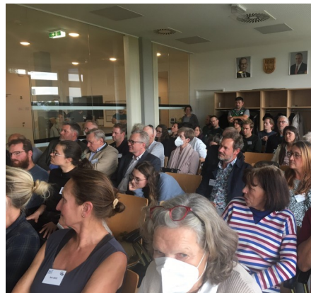
Abbildung 15 SIL Austria Meeting in der Biologischen Station Illmitz am Neusiedlersee

Beim Treffen des Vereins der Limnolog:innen Österreichs ( SIL-Austria ) an der Biologischen Station Neusiedlersee in Illmitz erörterten Limnolog:innen, Geolog:innen und Hydrolog:innen die kritische Lage des Neusiedler Sees, der heuer viel Wasser verloren hat. Von 28. -30.9.2022 wurde bei Podiumsdiskussionen und Biologischen Exkursionen durch das Seevorgelände über “Steppenseen unter klimatischem Wandel –Vergangenheit, Gegenwart und Zukunft des Neusiedlersees“ diskutiert.