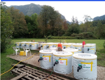
Abbildung 5: Mesokosmen für den Versuch in Lunz.

Wir entdeckten, dass verschiedene Gemeinschaften aus dem lokal verfügbaren Artenpool hervorgehen und ihre Bedeutung in Bezug auf die Ressourcennutzung mit der Zeit zunimmt. Zusätzlich wurde beobachtet, dass Selektion von erfolgreichen und damit dominanten Arten oft zu einer Verringerung der Diversität der Gemeinschaften führen, was die ursprüngliche Hypothese bestätigte..