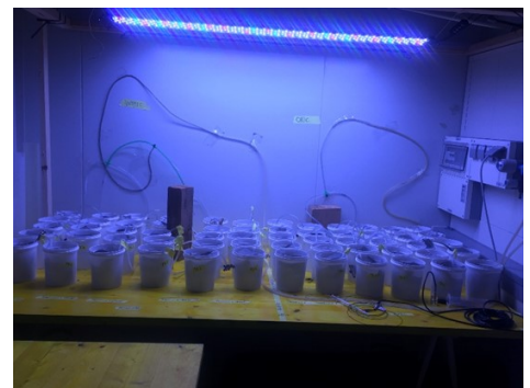
Abbildung 8: Experimentaufbau: 60 x 1 Liter Becher als Mesokosmen—Zuhause der Köcherfliegen für 27 Tage