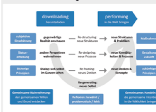
Abbildung: Komplexität des Lernens in und von Systemen, Theorie-U (nach Scharmer 2011)

Beim Gang durch das U gibt es horizontale „Abkürzungen“ (Re-structuring, Re-designing, Re-framing). Man muss sich genau überlegen, ob das Nehmen dieser „Abkürzungen“ wirklich zum gewünschten Erfolg führt. Veränderungsprozesse scheitern immer mehr, die auf diese Abkürzungen zurückgreifen. Denn je komplexer die Herausforderungen werden, je weniger helfen hergebrachte Antworten und Methoden. Der Weg durch das U ist allerdings nicht als ein vorstrukturierter Prozess zu begreifen, der einfach nur hintereinander abgearbeitet werden kann. Die Schritte bedingen sich gegenseitig und schließen sich gleichzeitig ineinander ein. Vor dem „Gang durch das U“ ist es zwingend erforderlich, die Beteiligten genau über das big picture zu informieren. „Von der Zukunft her führen“ bedeutet, Potenziale und Zukunftschancen zu erkennen und im Hinblick auf aktuelle Aufgaben zu erschließen.